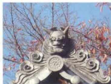
山門の鬼瓦(東側)こちらは口を閉じて穏やかな表情です。