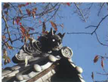
山門の鬼瓦(西側)口を開けて威嚇しているような表情です。